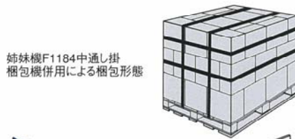
姉妹機F1184中通し掛 梱包機併用による梱包形態